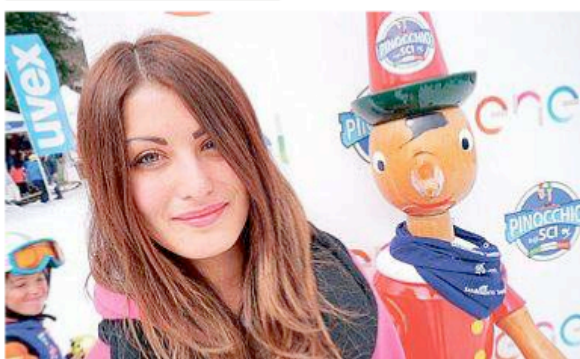
Belle ragazze e burattini al «Villaggio di Pinocchio», allestito alla partenza dell'Ovovia